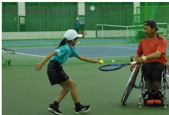
ボールパーソンの小学生