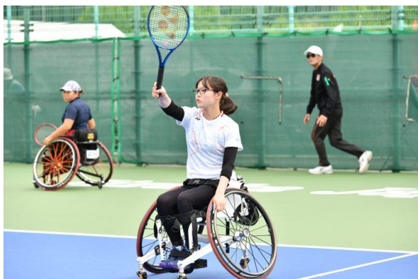
女子ダブルス決勝