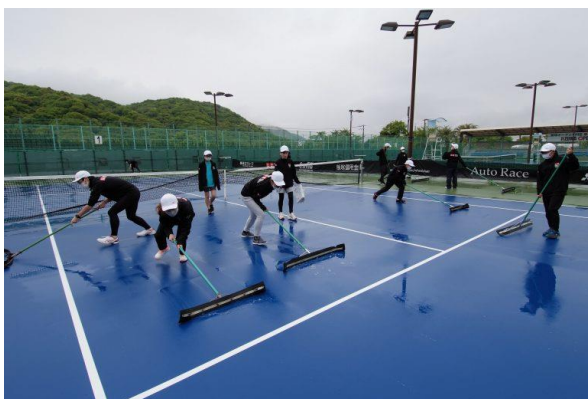
水はけをするボランティア