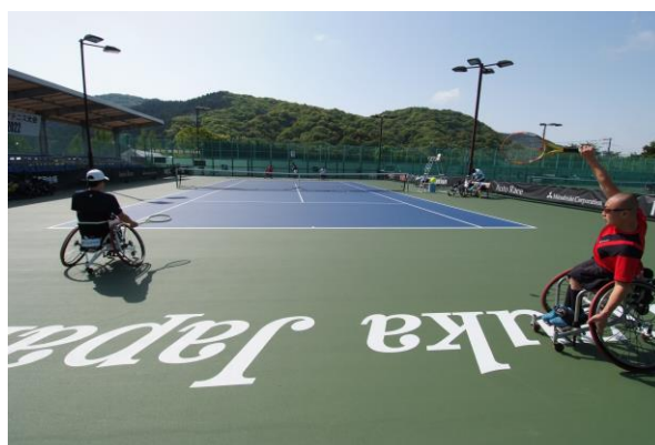
男子ダブルス決勝