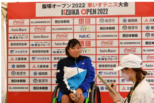
新聞社のインタビュー